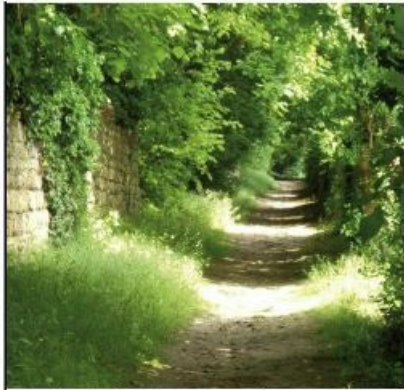
Sente des Mathurins, une des nombreuses sentes préservées qui parcourt les coteaux de l'Hermitage.

Accueil > Impression pdf > Le quartier de l'Hermitage