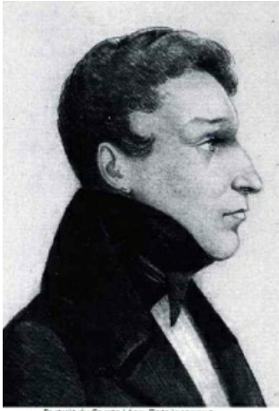
Portrait du Comte Léon. Date inconnue

Accueil > Impression pdf > Le fils de Napoléon enterré à Pontoise