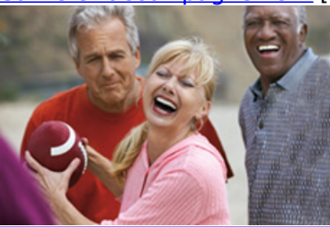
• Seniors [13]