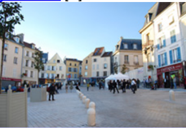
• Lien social et Associations de quartiers [9]