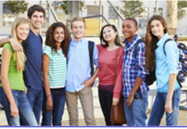
• Jeunesse [8]