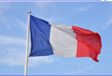
• Politique [11]