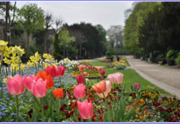
• Nature et environnement [10]