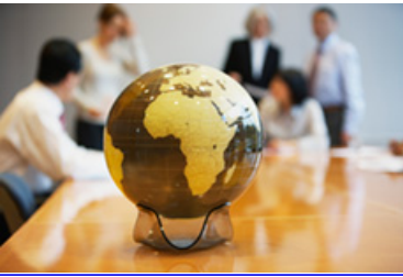
• International [7]